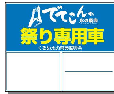
図A：マグネットシート